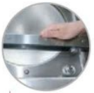
Barre saldanti estraibili Removable sealing bars