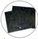
Set tavolo di riempimento in polietilene Polyethylene filling squares set