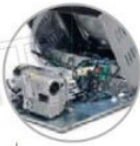
Carter apribile a 90° 90° openable carter