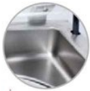
Vasca inox con angoli stondati senza saldature Entirely printed stainless steel vacuum chamber, with internal round corners