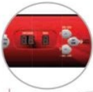
Pannello digitale Digital panel