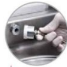
Connessione per attacco gastrovac Connection for the gastrovac system