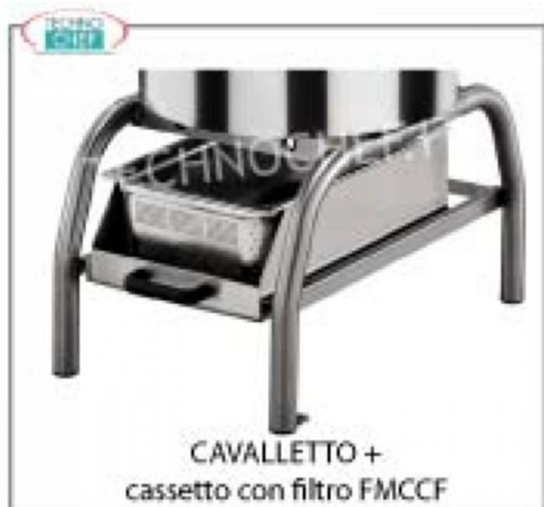
CAVALLETTO + cassetto con filtro FMCCF