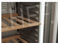
Ripiani regolabili in legno