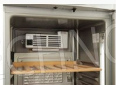
Ventilatore interno di assistenza