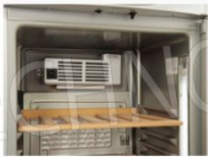
Ventilatore interno di assistenza