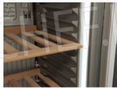
Ripiani regolabili in legno