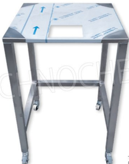
Tavolo di supporto su ruote (Optional)