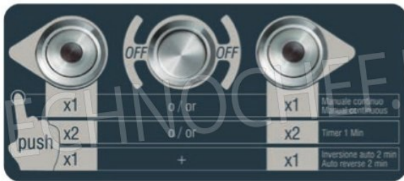
Sistema di controllo: 2 programmi + uso manuale Control system: 2 prest programs + manual use