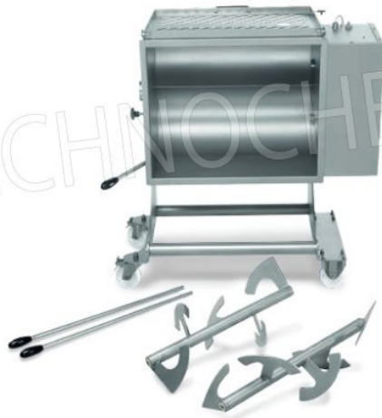
Pala facilmente rimovibile Removable mixing arms