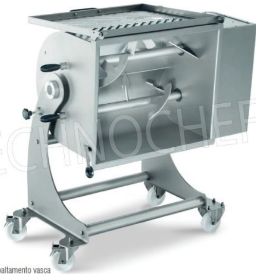
Ribaltamento vasca Tank overturn