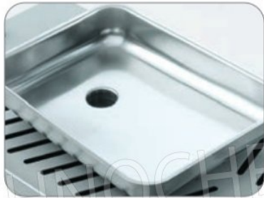
Opzione tramoggia per aggiunta ingredienti Optional feed tray for add ingredients