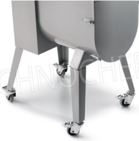
Gambe con ruote opzionali