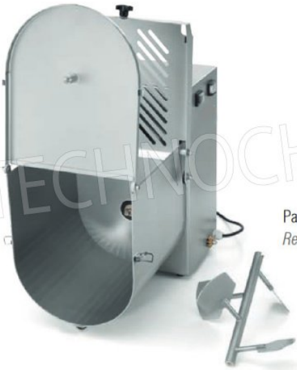
Pala facilmente rimovibile Removable mixing arm