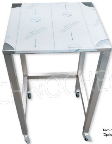
Tavolo di supporto su ruote (Optional)