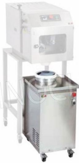
Esempio di sovrapposizione Porzionatrice - Arrotondatrice Example of overlapping Portioning - Rounding Machine