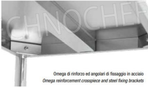
Omega di rinforzo ed angolari di fissaggio in acciaio Omega reinforcement crosspiece and steel fixing brackets