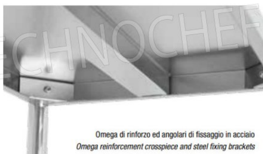
Omega di rinforzo ed angolari di fissaggio in acciaio Omega reinforcement crosspiece and steel fixing brackets