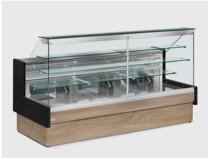
Il banco in foto è con i pannelli colore White Oak (Optional) e spalle in legno colore nero (Optional)