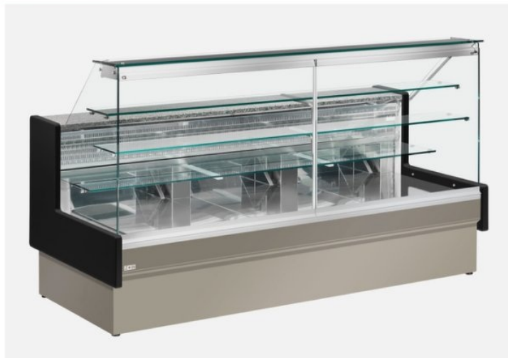
Il banco in foto è con i pannelli colore Tortora (Optional) e spalle in legno colore nero (Optional)