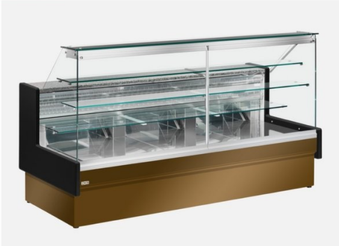
Il banco in foto è con i pannelli colore Grenade (Optional) e spalle in legno colore nero (Optional)