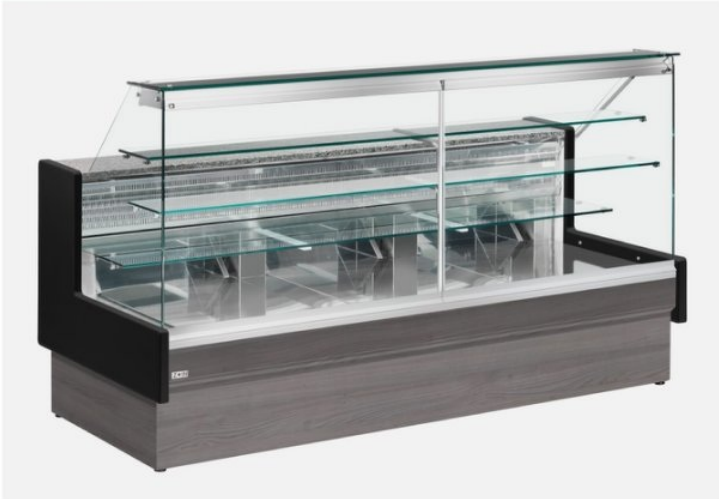
Il banco in foto è con i pannelli colore Urban Wood(Optional) e spalle in legno colore nero (Optional)