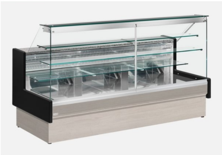
Il banco in foto è con i pannelli colore Larch Wood (Optional) e spalle in legno colore nero (Optional)