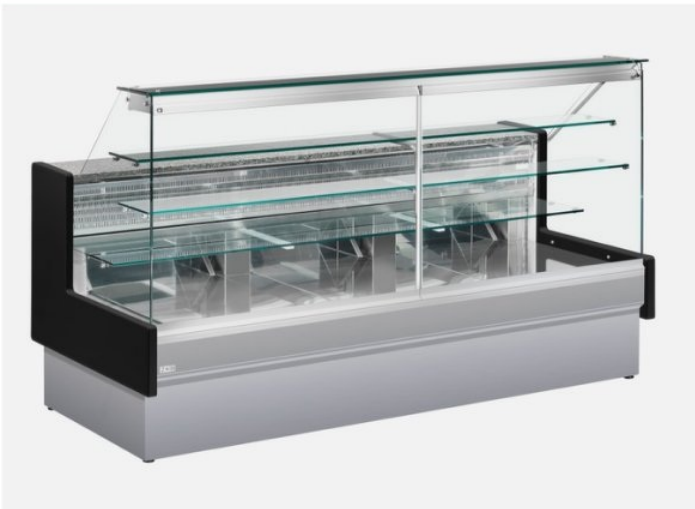
Il banco in foto è con i pannelli colore grigio (standard) e spalle in legno colore nero (Optional)