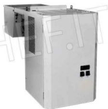
MOTORE ICE MONOBLOCCO