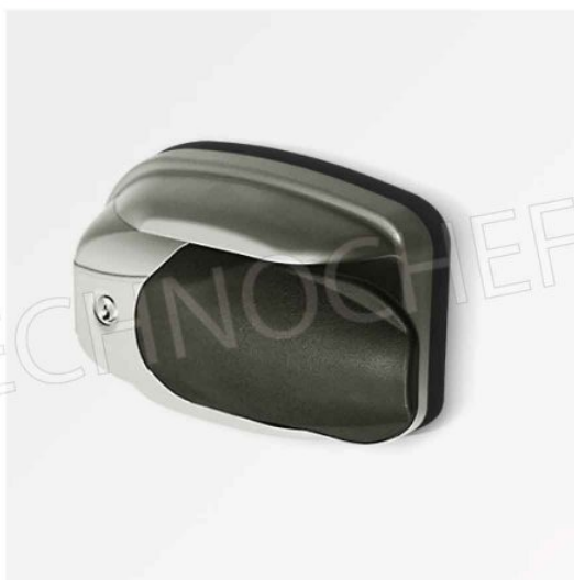
MANIGLIA STANDARD CON SERRATURA, CHIAVE A SBLOCCO INTERNO DI SICUREZZA