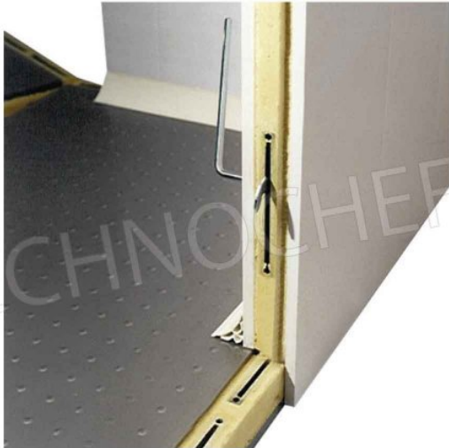
PAVIMENTO + PANNELLO: MONTAGGIO SEMPLICE E VELOCE TRAMITE FISSAGGIO CON AGGANCIO ECCENTRICO.