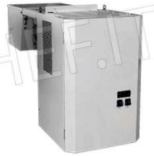
MOTORE ICE MONOBLOCCO