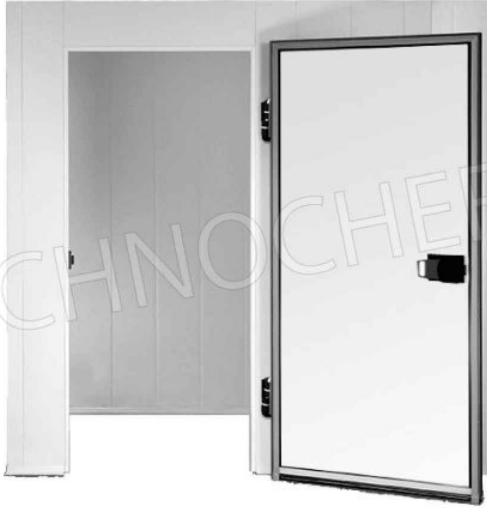
SU RICHIESTA: CELLA SENZA PAVIMENTO