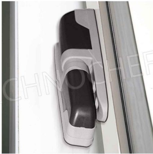
CERNIERE FACILMENTE REGOLABILI IN UTENZA IN 3 DIREZIONI