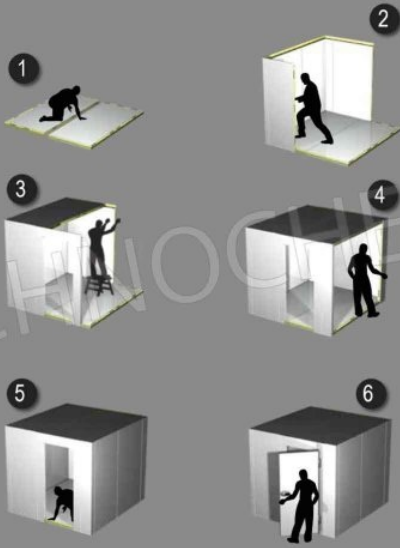
SEQUENZA DI MONTAGGIO PANNELLI