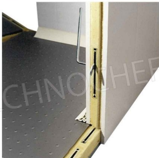
PAVIMENTO + PANNELLO: MONTAGGIO SEMPLICE E VELOCE TRAMITE FISSAGGIO CON AGGANCIAMENTO ECCENTRICO.