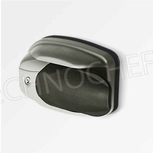
MANIGLIA STANDARD CON SERRATURA, CHIAVE A SBLOCCO INTERNO DI SICUREZZA