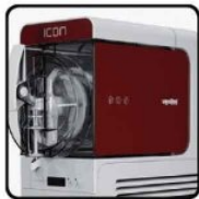
Grafiche per versione no visual