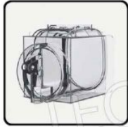
RECOVERENERGY anticondensa - per risparmio energetico sistema brevettato