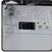
Controllo elettronico della temperatura