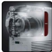
L : Luce frontale - tecnologia LED -