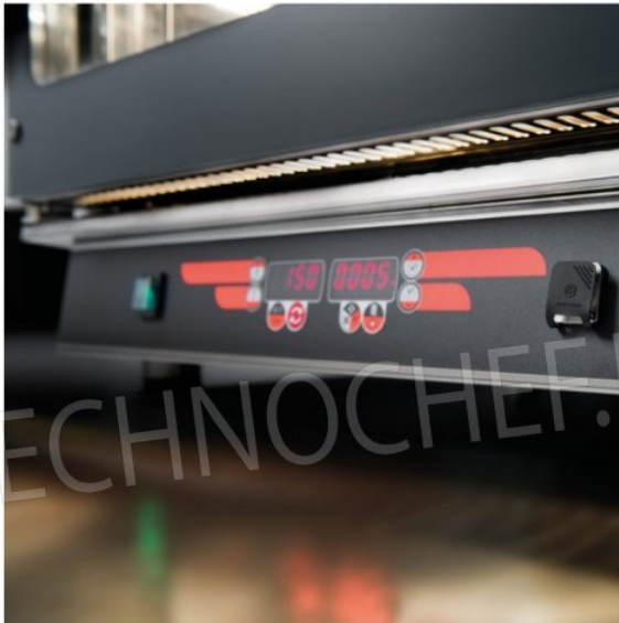
Pannello di controllo digitale