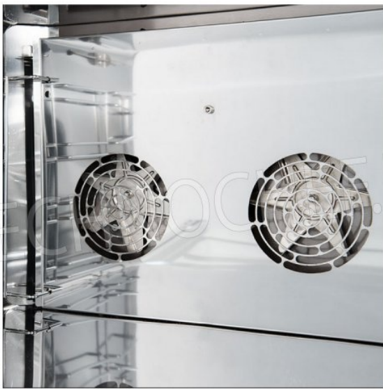
Realizzato con Acciaio Inox