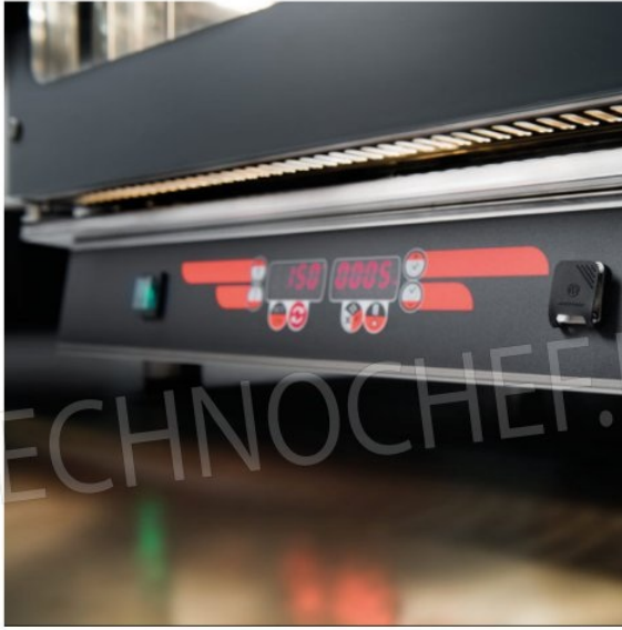
Pannello di controllo digitale