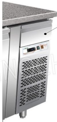
Cassetto neutro sopra vano tecnico