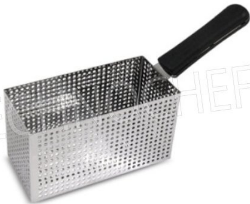
Cesto maxi opzionale