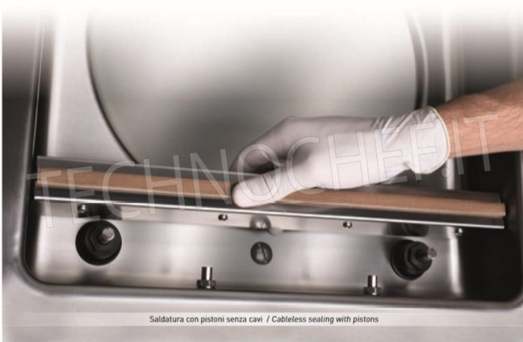
Saldatura con pistoni senza cavi / Cableless sealing with pistons