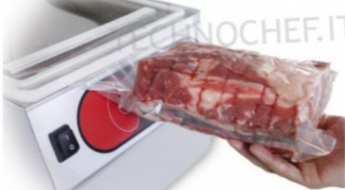
VUOTO ESTERNO CON BUSTE GOFFRATE