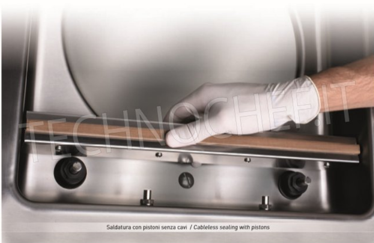
Saldatura con pistoni senza cavi / Cableless sealing with pistons