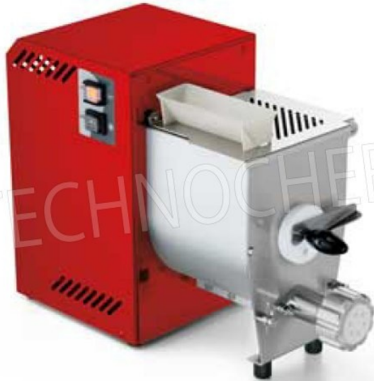
Cassa rossa opzionale