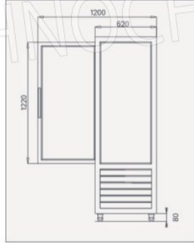
VISTA LATERALE Side view / Seitenansicht / Vue latérale