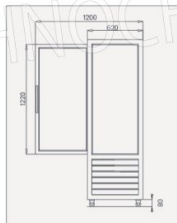
VISTA LATERALE Side view / Seitenansicht / Vue latérale