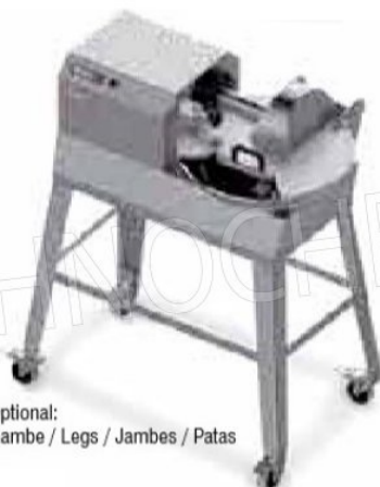
Optional: Gambe / Legs / Jambes / Patas