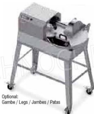
Optional: Gambe / Legs / Jambes / Patas