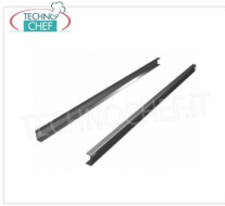
Coppia guida per teglie