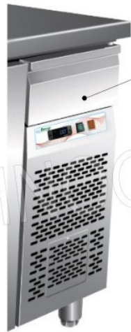
Cassetto neutro sopra vano tecnico