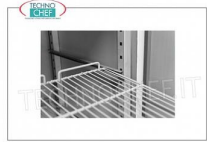
Forcar - Coppia guide antiribaltamento Coppia guide antiribaltamento per griglia