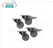
Forcar - Kit 4 ruote, 2 con freno Kit 4 ruote con diametro 120 mm, di cui 2 con freno.