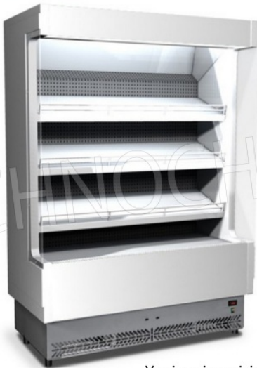
Versione in acciaio inox