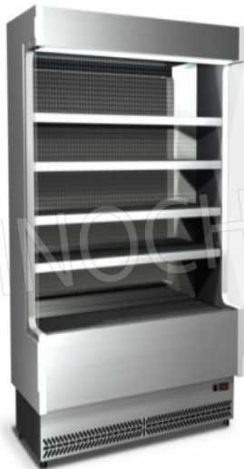
Versione in acciaio inox