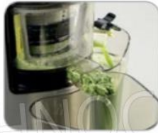
Vaschetta per gli scarti Tray for waste