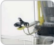
Tappo salvagoccia Drip cap