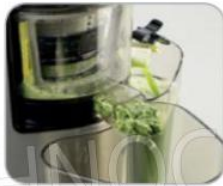
Vaschetta per gli scarti Tray for waste