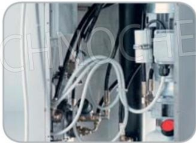
Particolare centralina e comandi