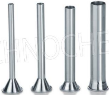
Imbuti inox (ø 13-16-20-25-28-38) opzionali