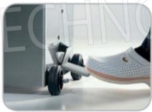
Azionamento spinta pistone