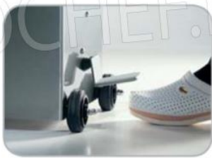
Ritorno pistone automatico