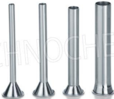
Imbuti inox (ø 13-16-20-25-28-38) opzionali