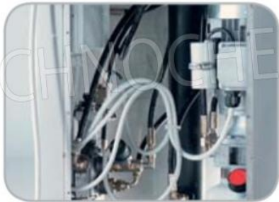
Particolare centralina e comandi