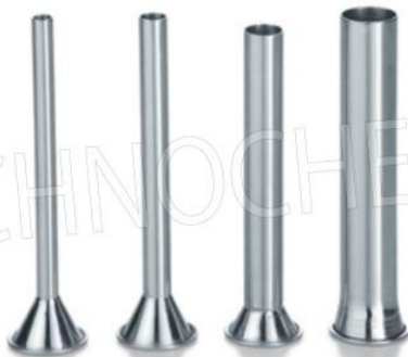
Imbuti inox (ø 13-16-20-25-28-38) opzionali