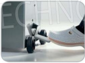
Azionamento spinta pistone