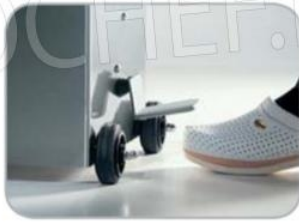
Ritorno pistone automatico