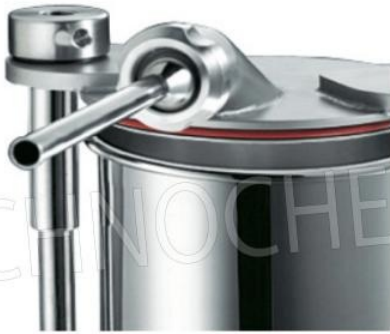
Ghiera inox opzionale