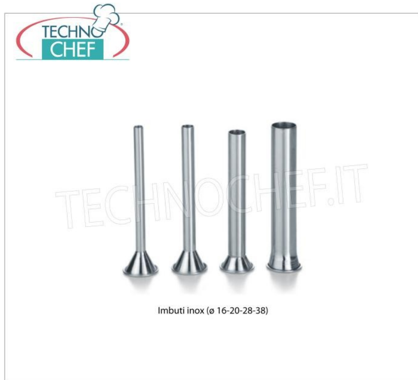
Imbuti inox (ø 16-20-28-38)