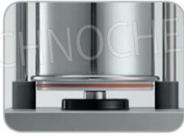
Guarnizione ermetica su cilindro oleodinamico