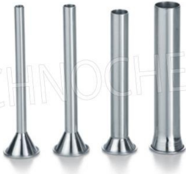
Imbuti inox (ø 13-16-20-25-28-38) opzionali