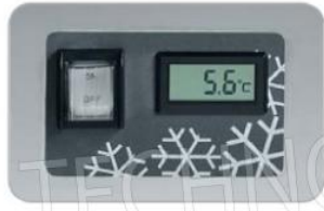
Comandi TC ICE TC ICE controls