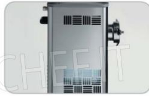
Griglie di ventilazione TC ICE TC ICE airing take