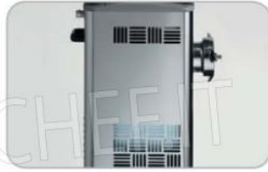
Griglie di ventilazione TC ICE TC ICE airing take