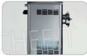
Griglie di ventilazione TC ICE TC ICE airing take