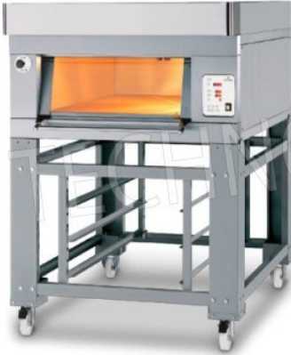
PASTFOOD - H27

Forno elettrico modulare con camera di cottura in lamiera di acciaio alluminata di altezze diverse. Piano di cottura in refrattario o in lamiera bugnata. Elementi riscaldanti elettrici ad altissime prestazioni.