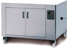
Cella di lievitazione BC8 - dim.mm.1320x960x700h