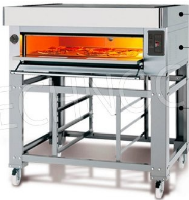
Modulo cappa KC8 - dim.mm.1320x1130x160h