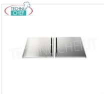
TECHNOCHEF - Kit Portine anteriori per vano a giorno, Mod.14080325 Kit portine anteriori per griglia a pietra lavica Mod.I-80MOB/P