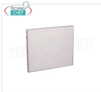
TECHNOCHEF - Chiusura Posteriore, Mod.001020118 Chiusura posteriore per Mod.I-80MOB/P