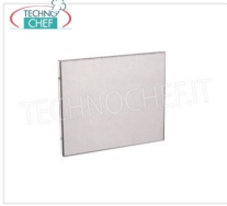
TECHNOCHEF - Chiusura Posteriore, Mod.01160328 Chiusura posteriore per griglia a pietra lavica Mod.I-65MOB