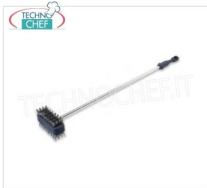
TECHNOCHEF - Spazzola Doppia, Mod.10080037 Spazzola doppia per pulizia grigliato