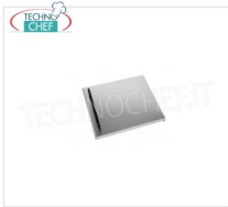
TECHNOCHEF - Portina anteriore per vano a giorno, Mod.14080324 Portina anteriore per griglia a pietra lavica Mod.I-65MOB