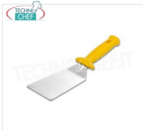
TECHNOCHEF - Paletta, Mod.10080038 Paletta