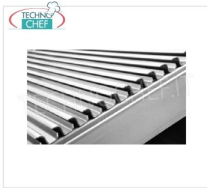
TECHNOCHEF - Grigliato di Cottura Universale, Mod.14080055 Grigliato di cottura universale per griglia a pietra lavica Mod.I-65 e I-65MOB, dim.mm.550x535.