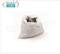
TECHNOCHEF - Confezione pietra lavica, Mod.05050501 Confezione pietra lavica