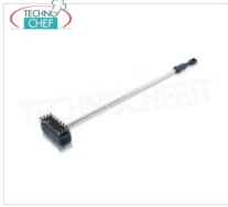
TECHNOCHEF - Spazzola Doppia, Mod.10080037 Spazzola doppia per pulizia grigliato