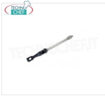
TECHNOCHEF - Raschietto, Mod.14080123 Raschietto per grigliato cottura universale