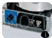
Mod. SI-C4VV SI-C6VV SI-C9VV