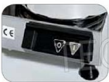
Mod. SI-C4 SI-C6