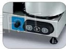
Mod. SI-C4VT SI-C6VT