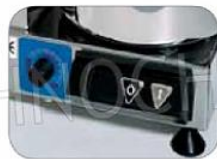
Mod. SI-C4VV SI-C6VV SI-C9VV