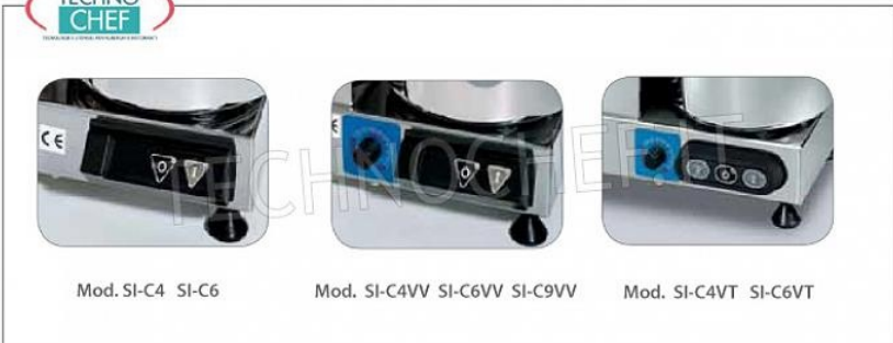
Mod. SI-C4 SI-C6