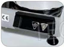
Mod. SI-C4 SI-C6