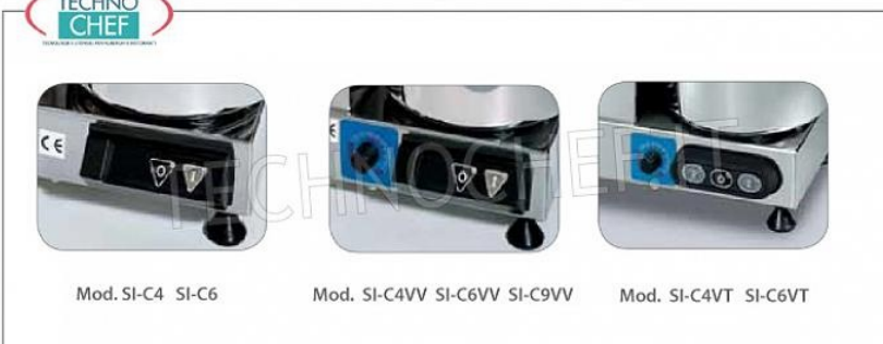
Mod. SI-C4 SI-C6