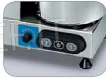
Mod. SI-C4VT SI-C6VT