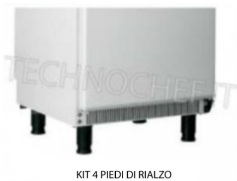
KIT 4 PIEDI DI RIALZO