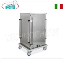
Ventilato per 8 Teglie GN 1/1 (mm 325x530) - mod. MC-3208GN-K