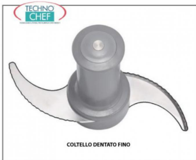
COLTELLO DENTATO FINO

Servizi e tecnologie per la ristorazione dal 1973 ... Services and Technologies for professional catering since 1973