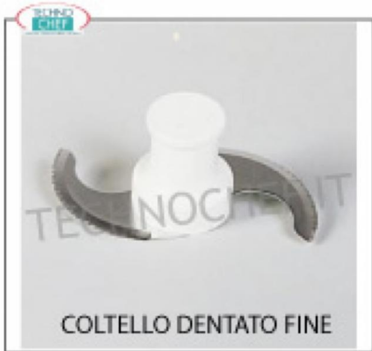
COLTELLO DENTATO FINE