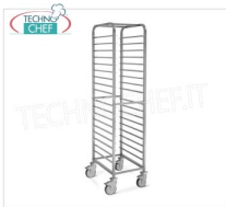
GN 1/1, Saldato, Mod.2062S