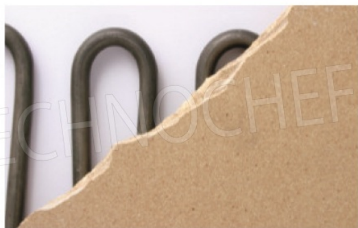
Particolare del piano di cottura in materiale refrattario e delle resistenze corazzate.